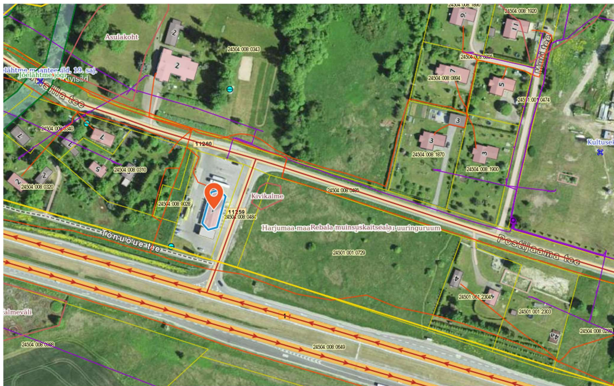
Joonis 1.1. Tööde piirkond.